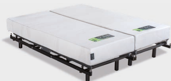
Plan médical incliné