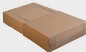
option Lift emballée