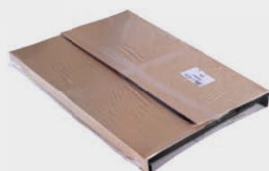
option Declive emballée